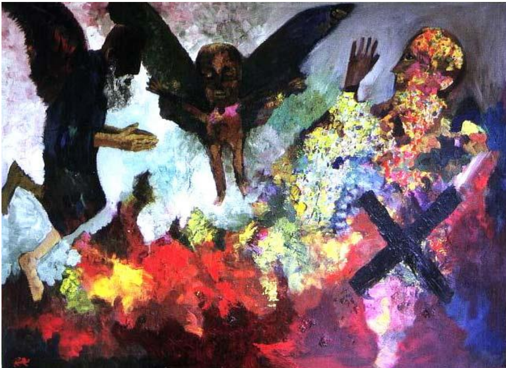
Das Kreuz, Öl, 160x200 cm, 1998